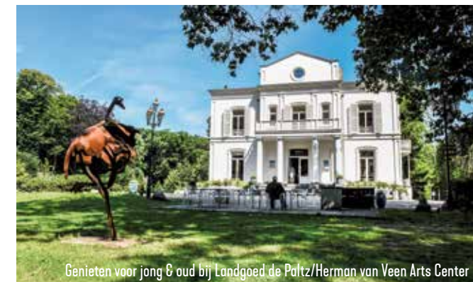
Genieten voor jong & oud bij Landgoed de Paltz/Herman van Veen Arts Center