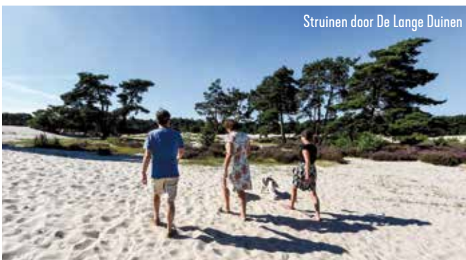
Struinen door De Lange Duinen