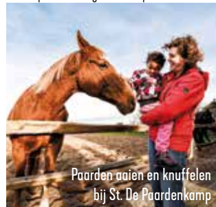
Paarden aaien en knuffelen bij St. De Paardenkamp

There is so much to explore! You are sure to find a warm welcome at the many different types of accommodation available, from simple farmer's campsites to holiday parks and from hostel to luxury hotel stays. Tip! Have a look at soest.opdeheuvelrug.nl for the possibilities.