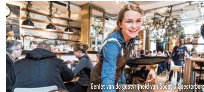
Geniet van de gastvrijheid van Soest & Soesterberg